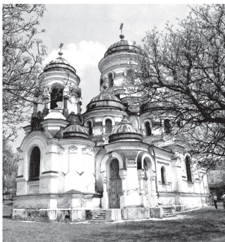
Biserica „Sfântul Gheorghe” de la Mănăstirea Căpriană

Semn că ne vede, semn că ne-aude Dragostea Putnei în zi de duminică. Când în lumina viselor ude Rană pe rană în taină se vindecă.